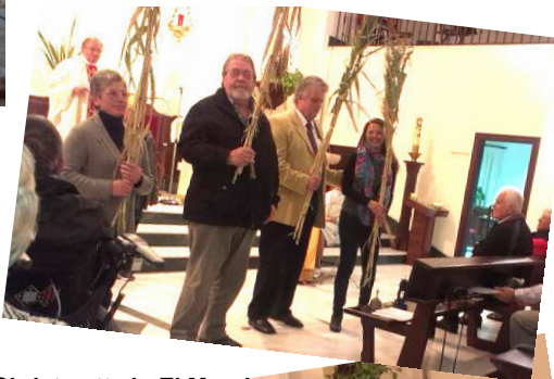
Christmette in El Morche

Wegen des starken Sturmes am 19.12.2013 musste der Weihnachtsgottesdienst der Deutschen Schule, der in der Kirche von Elviria geplant und vorbereitet war, leider ausfallen. Das eingeübte Weihnachtsspiel konnte dennoch aufgeführt werden: improvisiert in der Christmette in El Morche und am Weihnachtstag mit Schulkindern in El Ángel. Die jüngere Tochter füllt die Halle des Schlosses mit dem, was die Menschen brauchen, mit Licht, und sie wird die neue Königin. Soweit die Geschichte. Weihnachten sagt uns: Jesus ist unser Licht. Mit ihm kommt das Licht Gottes zu uns Menschen. Jede Familie erhält als kleines Geschenk für die Krippe zuhause ein Teelicht mit dem Schriftband: „Mit Jesus kommt das Licht zu uns.“