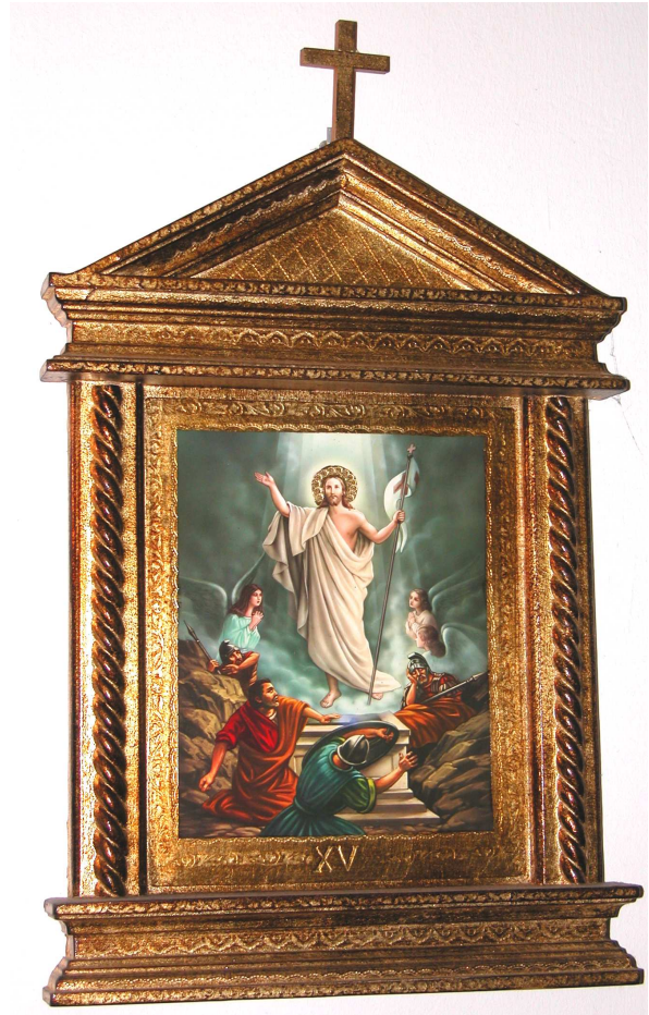
XV Jesus steht von den Toten auf