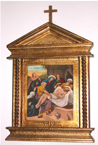
XIV Der heilige Leichnam Jesu wird in das Grab gelegt