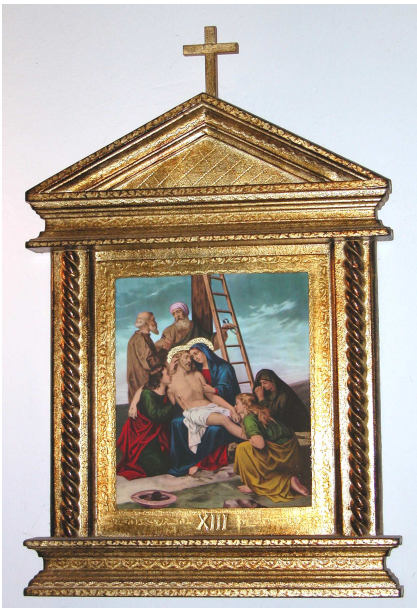
XIII Jesus wird vom Kreuz abgenommen und in den Schoß seiner Mutter gelegt