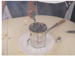
Asche für Aschermittwoch: Palmzweige vom Vorjahr werden verbrannt