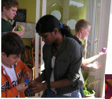
Frust-Frieda und Frust-Fred - eine Idee aus dem Misereor- kalender