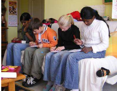
Nachschlagen und schnippeln für die „Bibelsuppe“