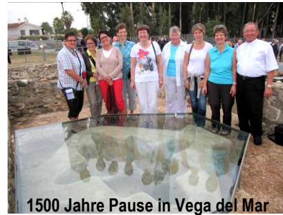
1500 Jahre Pause in Vega del Mar